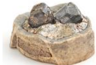
geöffnete Wachstumszelle, Diamanten bis 6 Carat